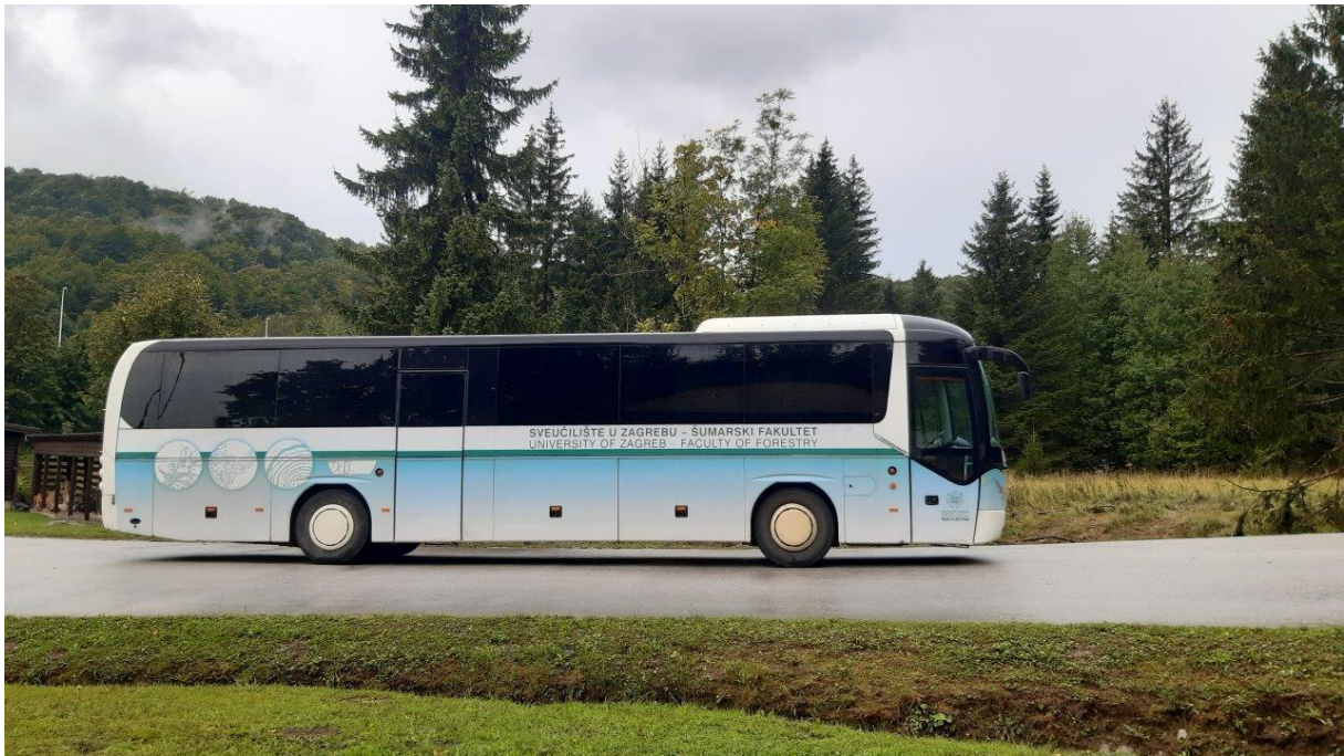
5. Autobus, będący na stanie Wydziału Leśnego w Zagrzebiu, którym podróżowaliśmy po Chorwacji.