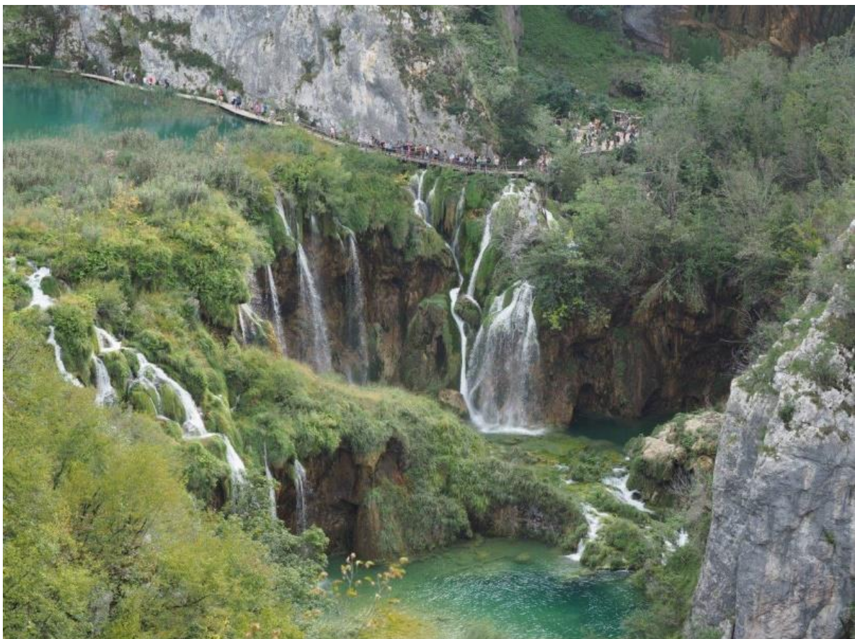
14. Jeden z wodospadów w PN Jezior Plitwickich.