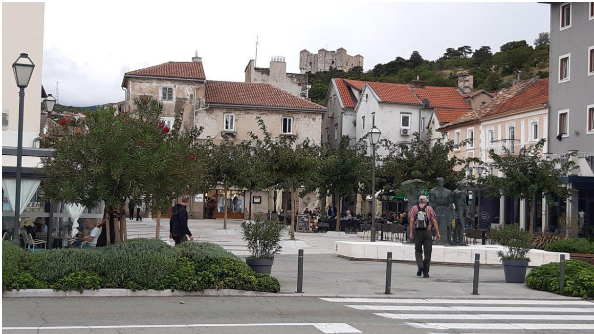
24. Nad miastem Senj góruje zamek Nehaj, który przez stulecia bronił Dalmacji przed okrętami Wenecjan.