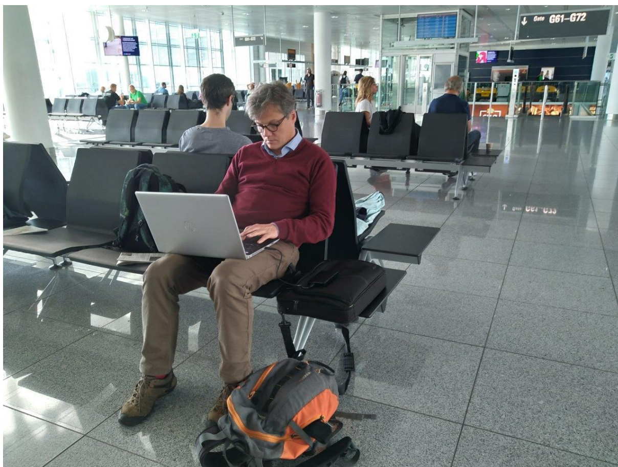
2. Nawet przerwy na lotniskach można dobrze wykorzystać.