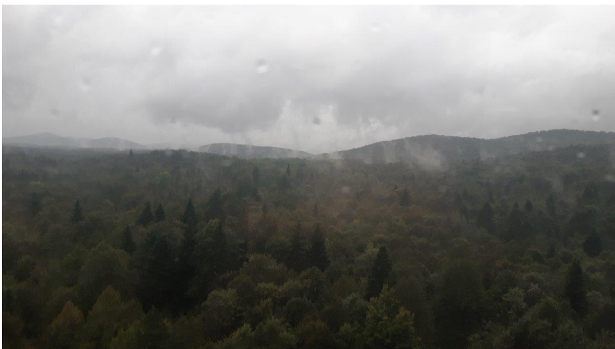
34. Podobny widok z naszego autobusu, wracającego do Zagrzebia w deszczowy dzień.