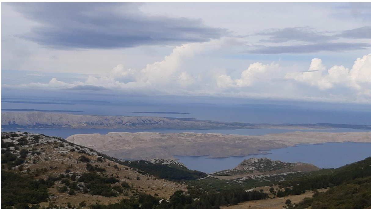
23. Adriatycki krajobraz, urozmaicony niezliczonymi wyspkami, zazwyczaj skąpo pokrytymi roślinnością.