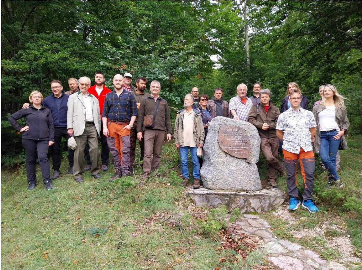
21. Zbiorowe zdjęcie uczestników spotkania Europejskiej Sieci Towarzystw Leśnych, przy kamieniu upamiętniającym powstanie w 1765 roku pierwszej chorwackiej leśniczówki, w miejscowości Baške Oštarije.