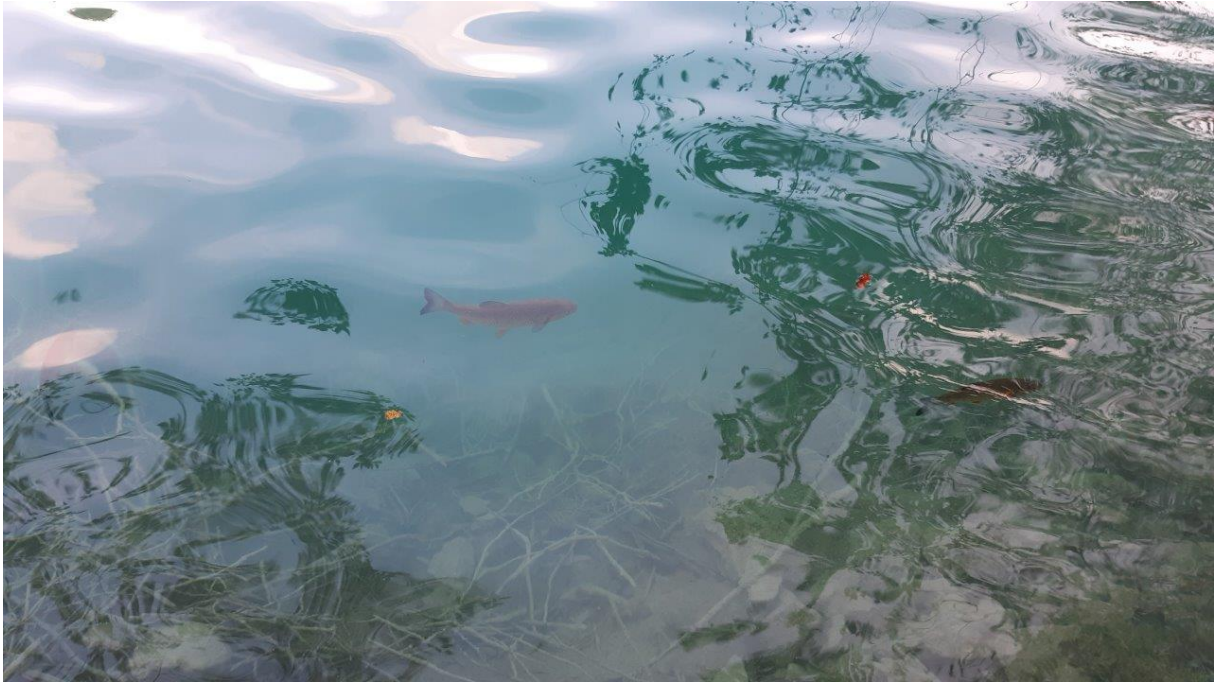
17. Plitwickie jeziora są pełne pstrągów.