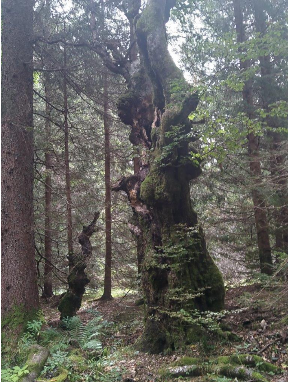
11. ... i magia.