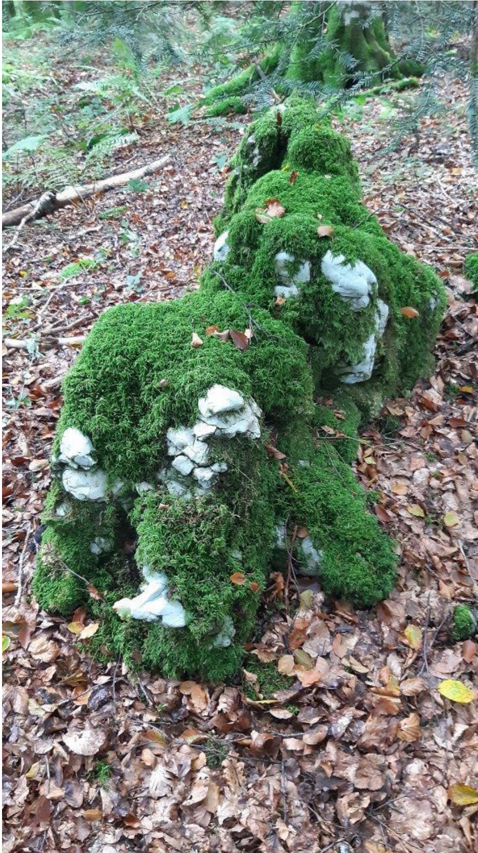
12. Pokryty mchem kamienny niedźwiadek nie jest groźny ale żyjącym tu prawdziwym niedźwiedzom lepiej w drogę nie wchodzić.