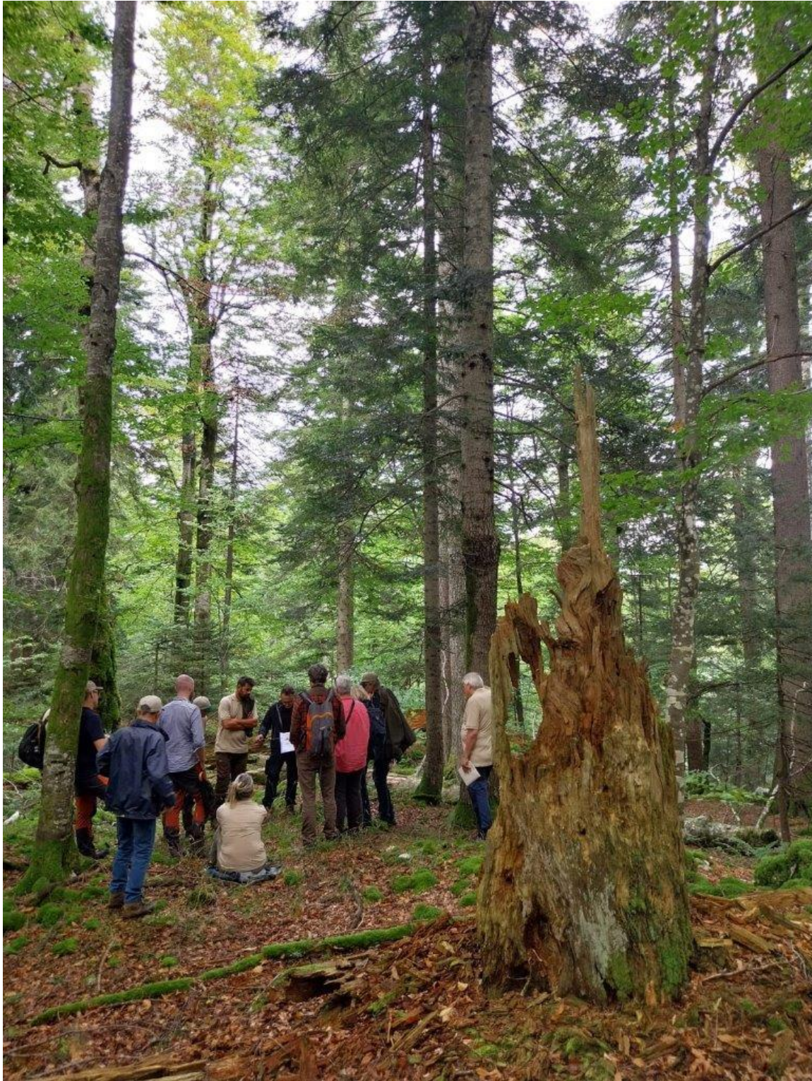
9. Stjepan Mikac opowiada nam o wynikach badań, prowadzonych w kompleksie Čorkova uvala od 1957 roku.