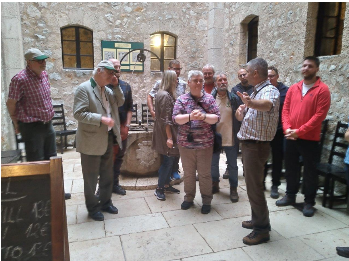
25. Zwiedzamy zamek Nehaj.