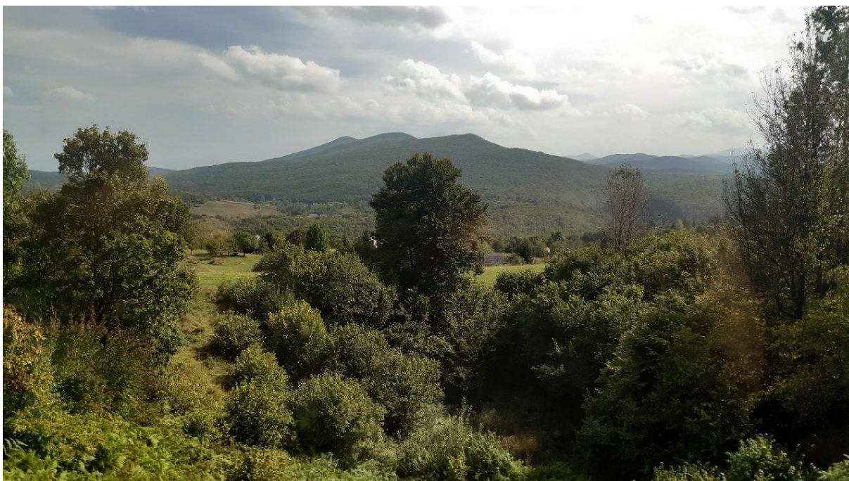
33. Typowy leśny krajobraz północnej Chorwacji, w pogodny dzień.