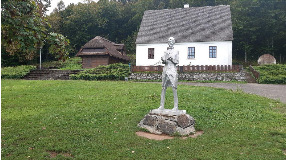
19. Pomnik Nikola Tesli w Smiljan, na tle domu, w którym ten genialny wynalazca urodził się 10.07.1856 roku.