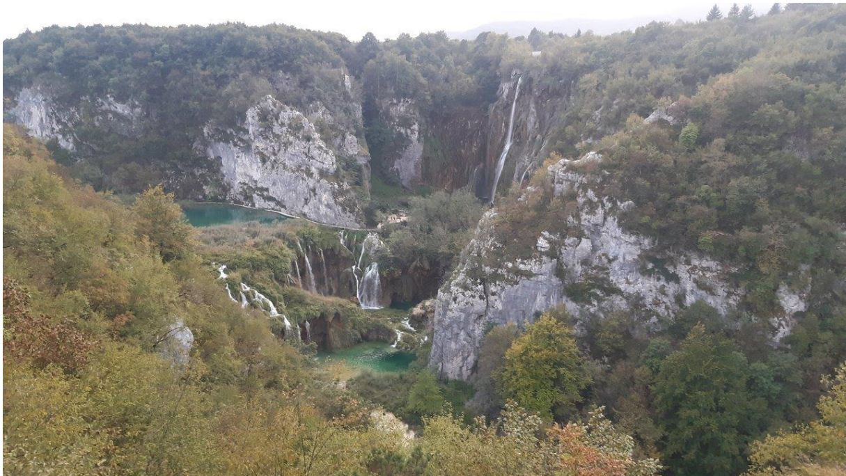
13. Park Narodowy Jezior Plitwickich to przepiękne lasy, jeziora, kaskady i wodospady.