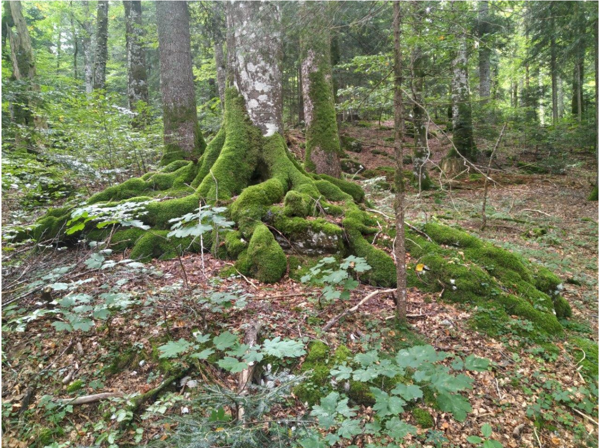
10. Wnętrze dziewiczego lasu tchnie naturalnością ...