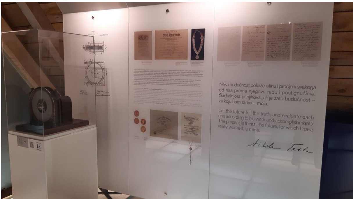
20. Jedna z ekspozycji, w muzeum urządzonym w rodzinnym domu Nikola Tesli. Po prawej stronie zacytowano jego słowa, mówiące właściwie o tym, że jego wynalazki wyprzedziły epokę, w której żył.