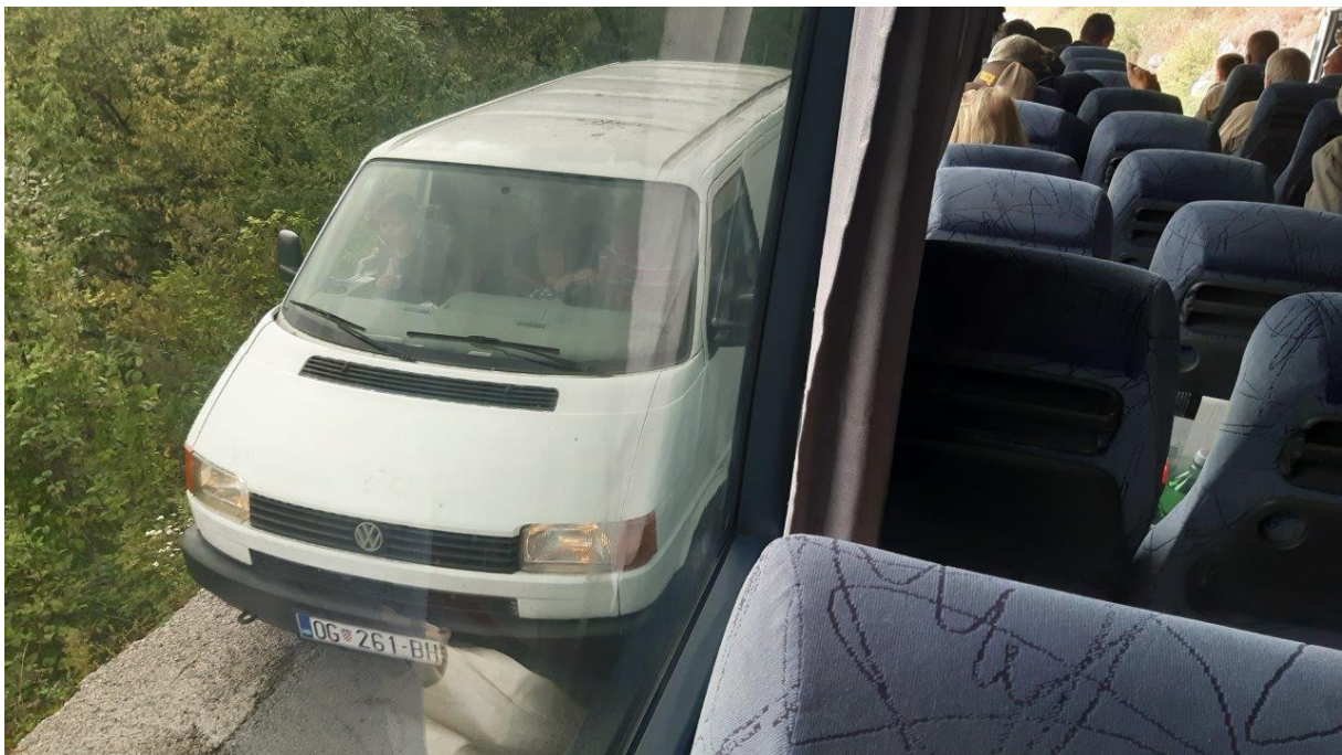
6. Takich mijanek, na wąskich leśnych drogach, było bez liku.