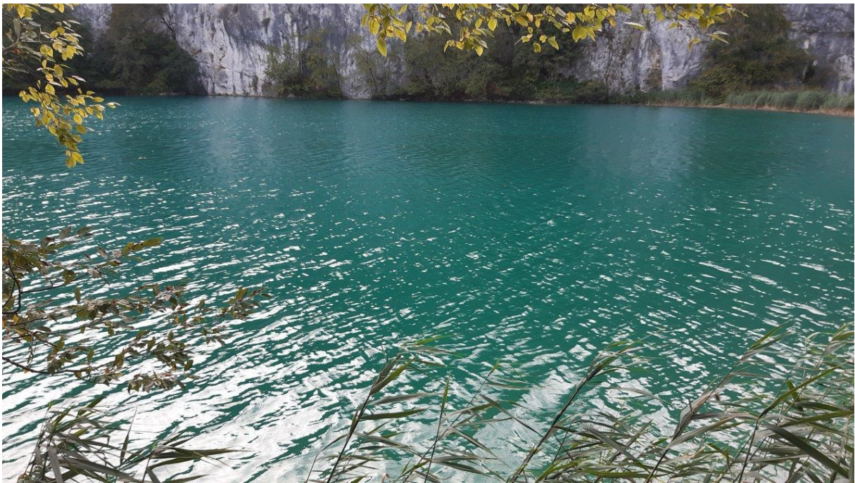
16. Dolomitowe brzegi i turkusowa toń jednego z jezior.