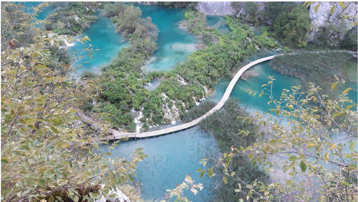
18. Widziana z góry tufowa bariera między jeziorami, na której położono kładkę dla zwiedzających PN Jezior Plitwickich.