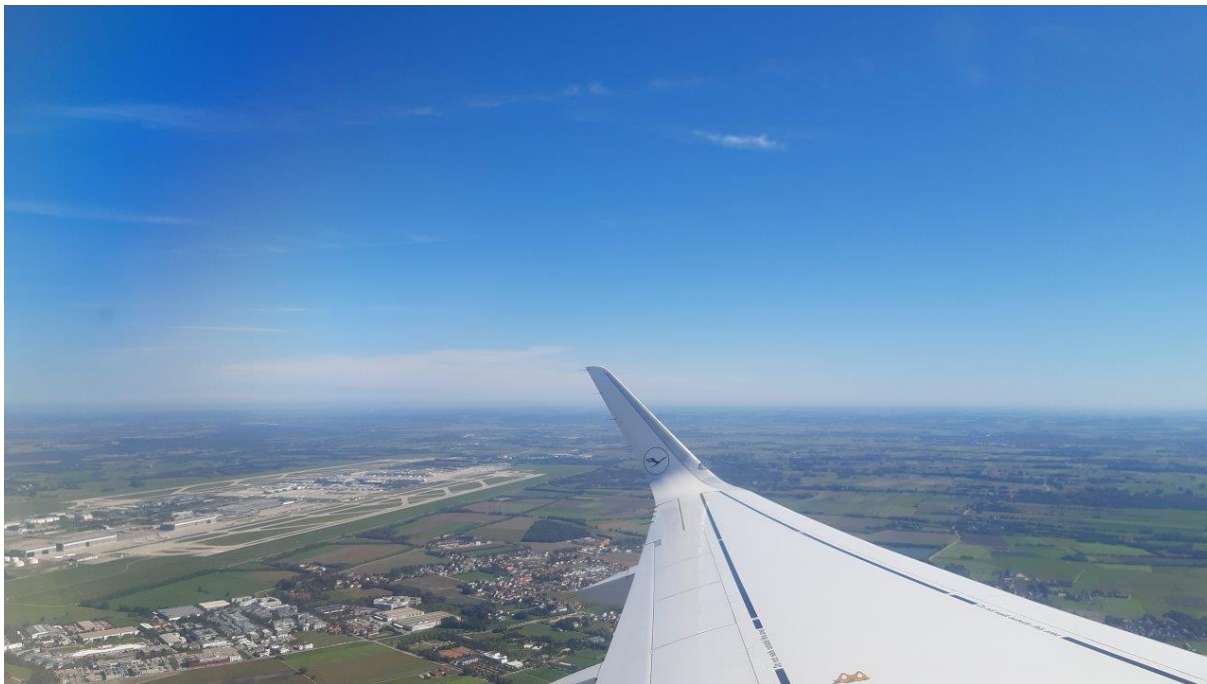
1. Lecimy do Zagrzebia.