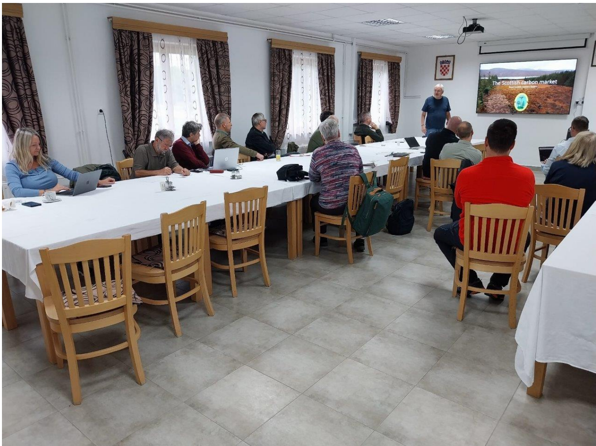
30. Ostatniego dnia, przed południem odbyła się w Zalesinie sesja Europejskiej Sieci Towarzystw Leśnych, podczas której przedstawiciele poszczególnych Towarzystw wygłosili prelekcje na temat aktualnej sytuacji lasów i leśnictwa w ich krajach.