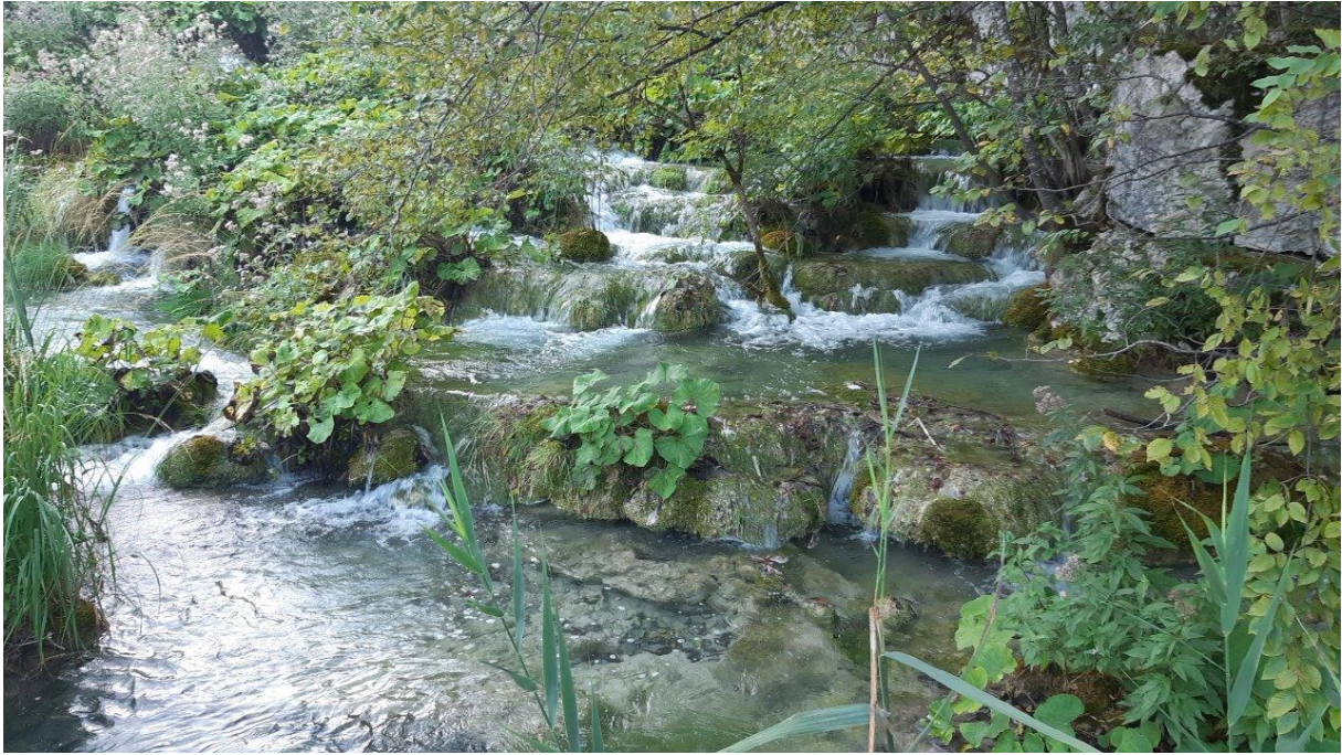
15. Charakterystyczne kaskady pomiędzy tarasowo położonymi jeziorami.