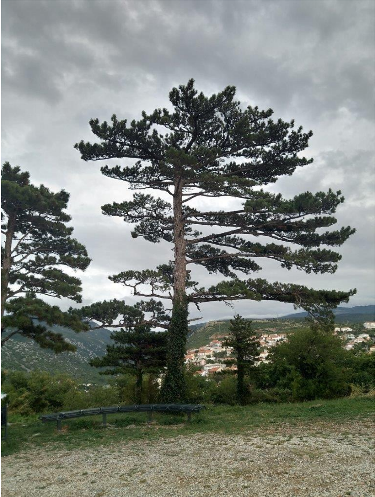
26. Na wzgórzu zamkowym rosą sosny czarne, potargane wiatrami bora.