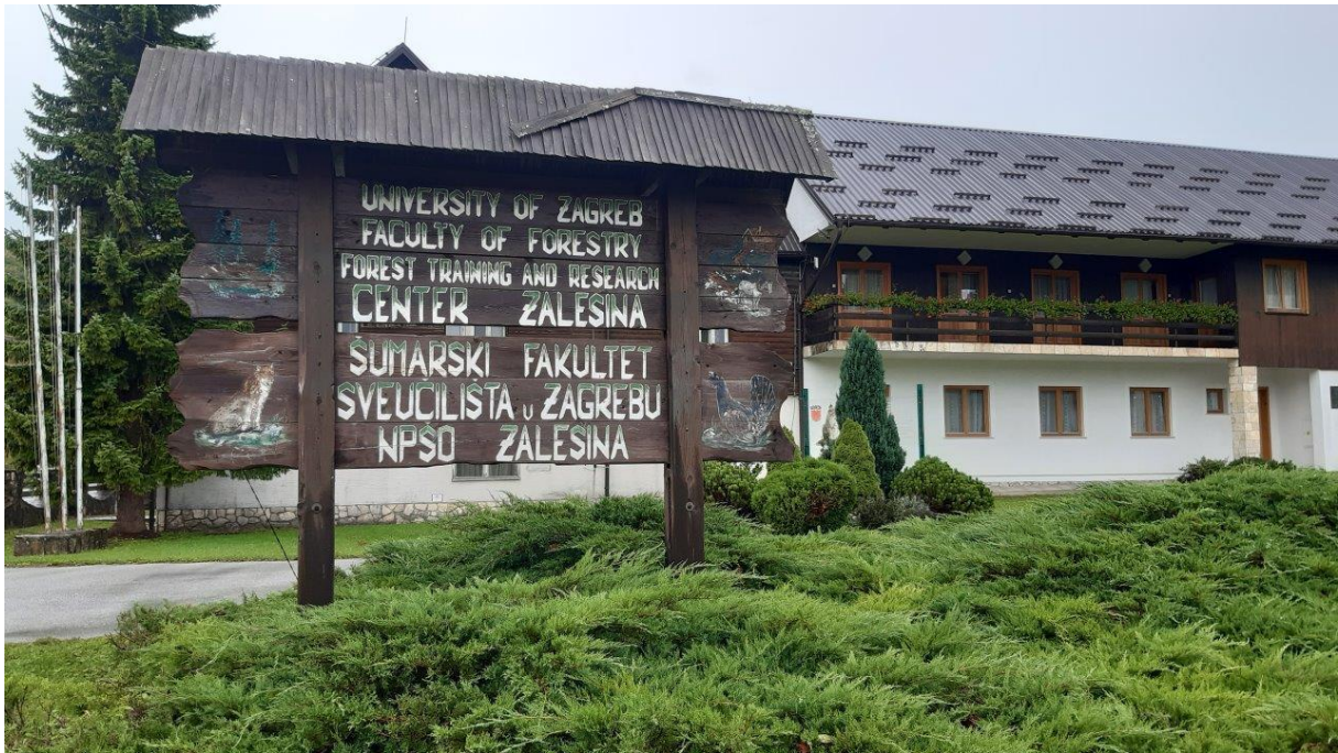
29. Tablica informacyjna na tle terenowego ośrodka naukowo-dydaktycznego Zalesina, należącego do Wydziału Leśnego w Zagrzebiu.